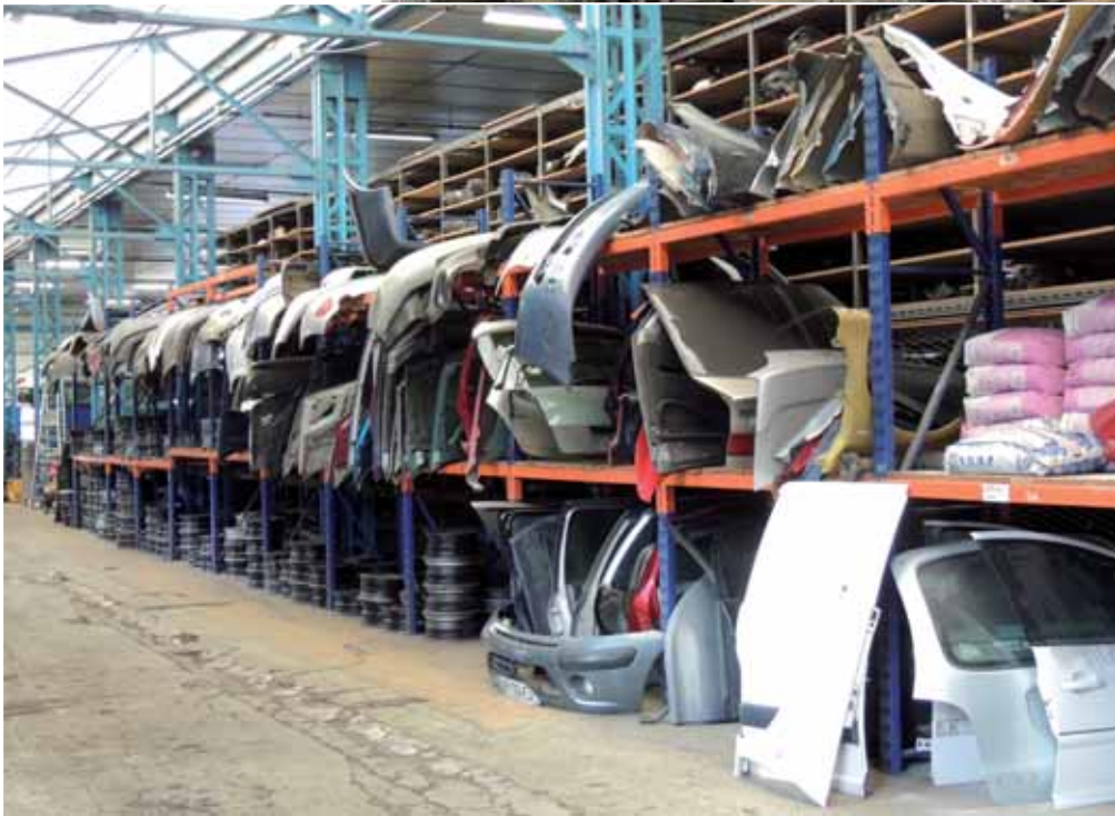
3 vues d'une partie de notre magasin de pièces de rechange (dont pièces de carrosserie)