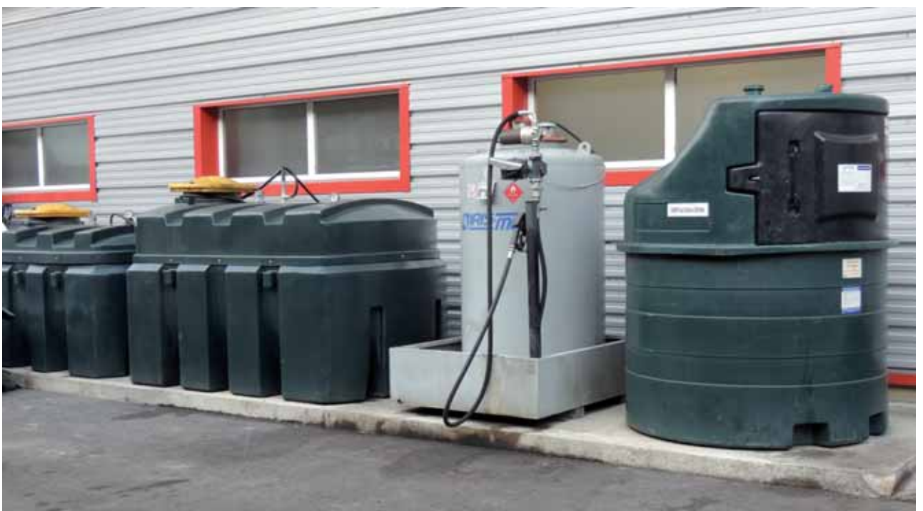
En bas : station de stockage des fluides, avec système de rétention