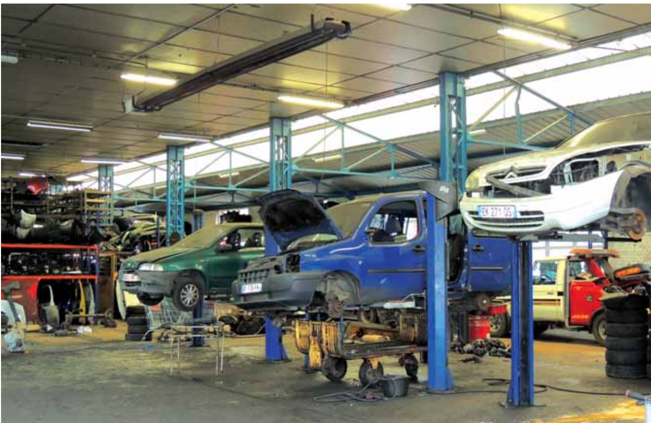
Atelier de démontage des véhicules