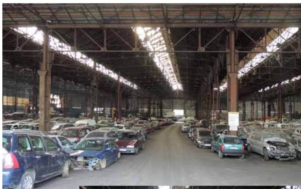
A gauche hangar de stockage des véhicules en attente de dépollution (12.000 2 couverts, surface bétonnée en totalité)