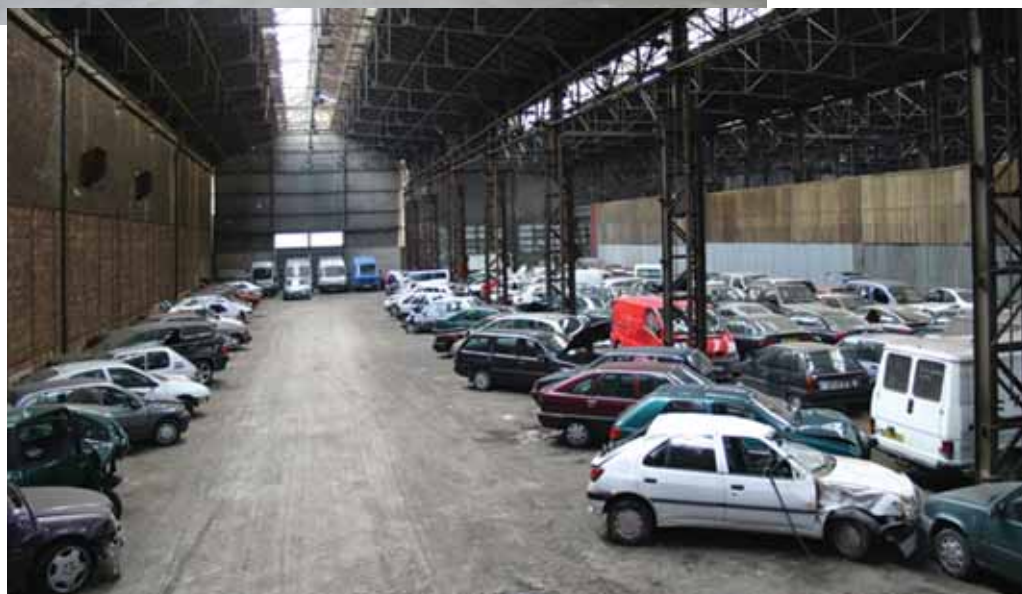
En bas aire de stockage des véhicules en attente de décision