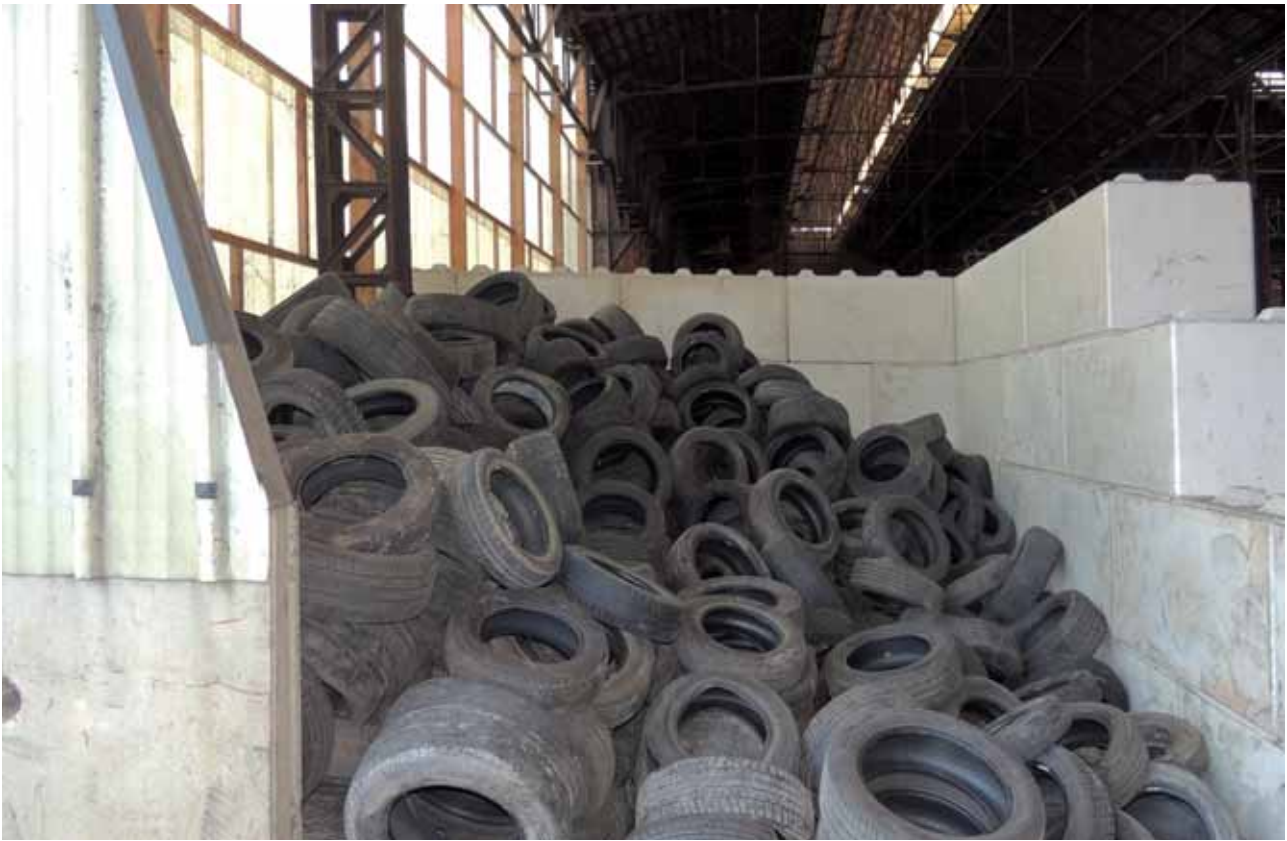
Alvéole de stockage des pneus