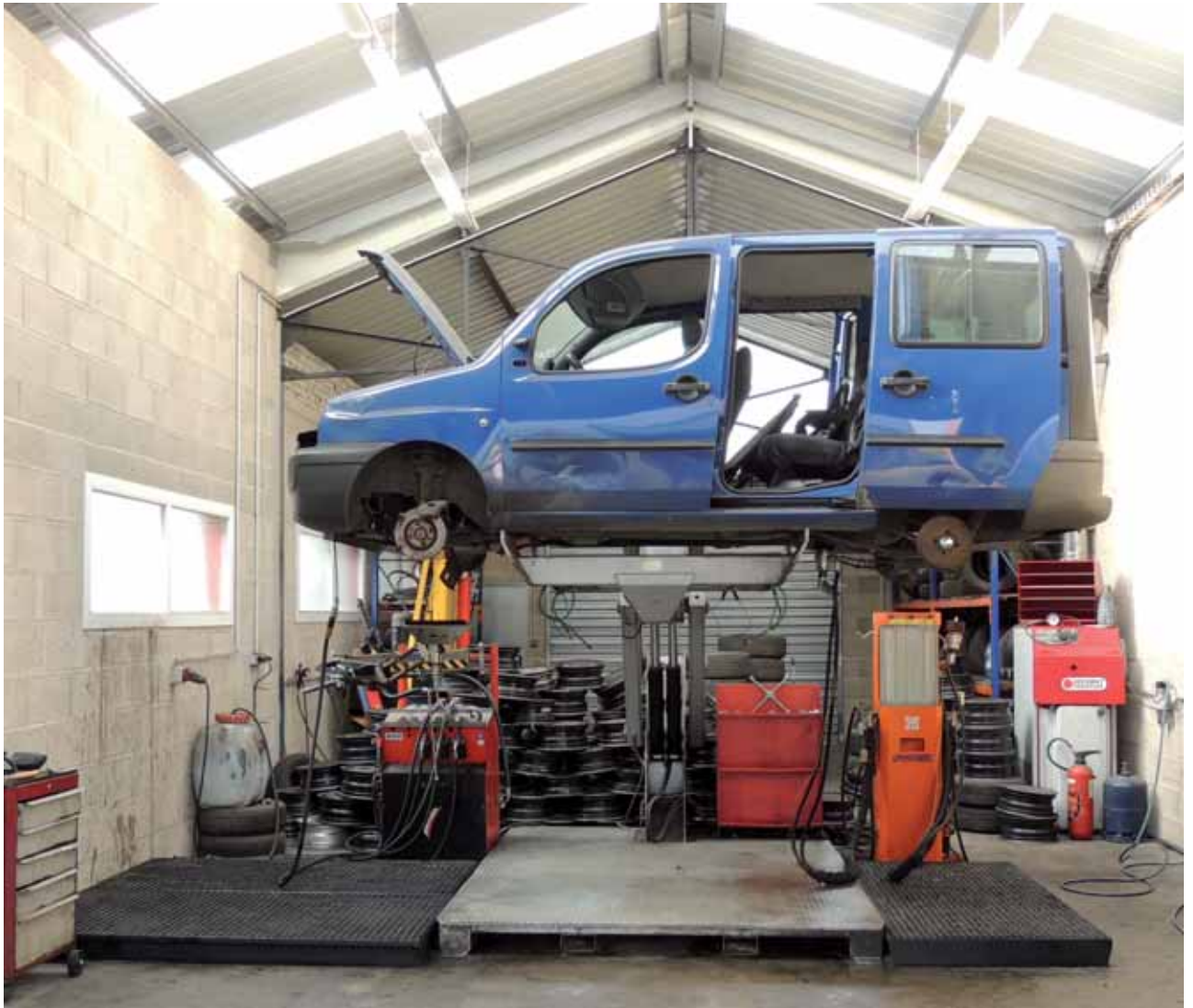
Bâtiment de la station de dépollution (par aspiration et filtration des fluides) et de démontage des roues