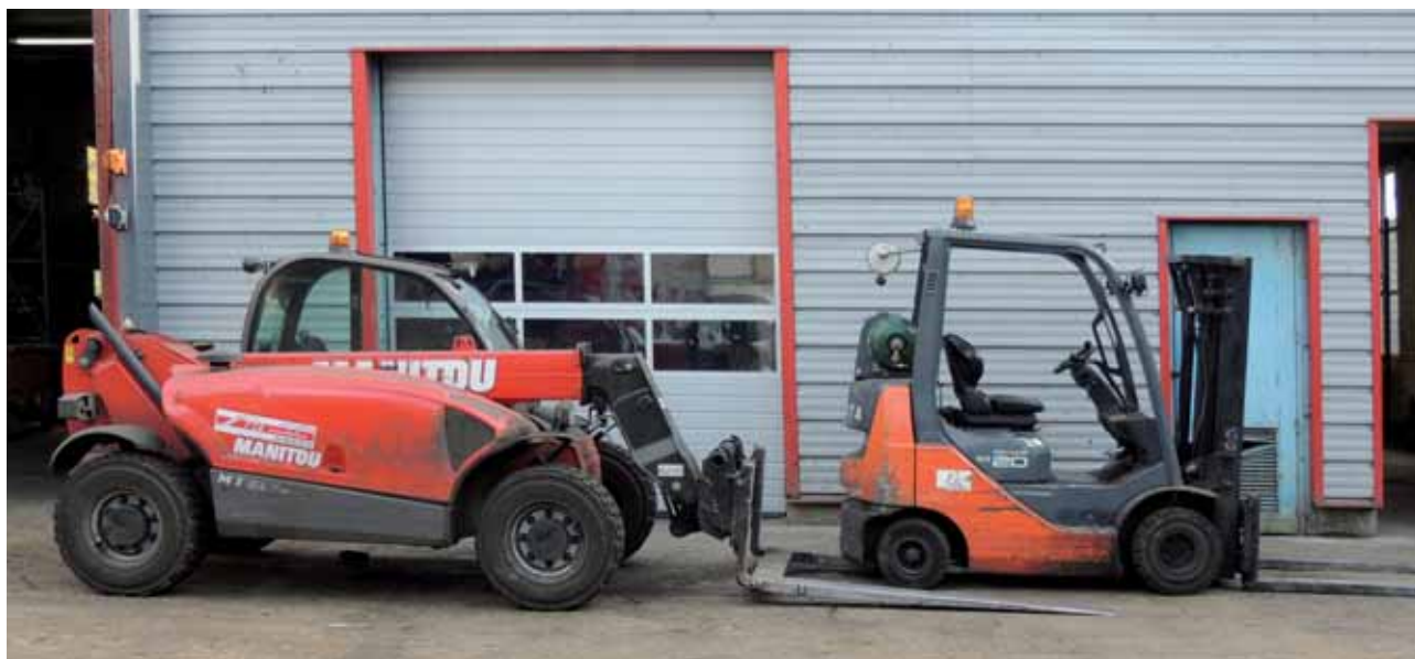
Nos moyens de manutention interne